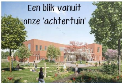
Een blik vanuit onze 'achtertuin'

We stellen jullie heel trots onze eerste beelden van ons nieuwbouwproject voor.