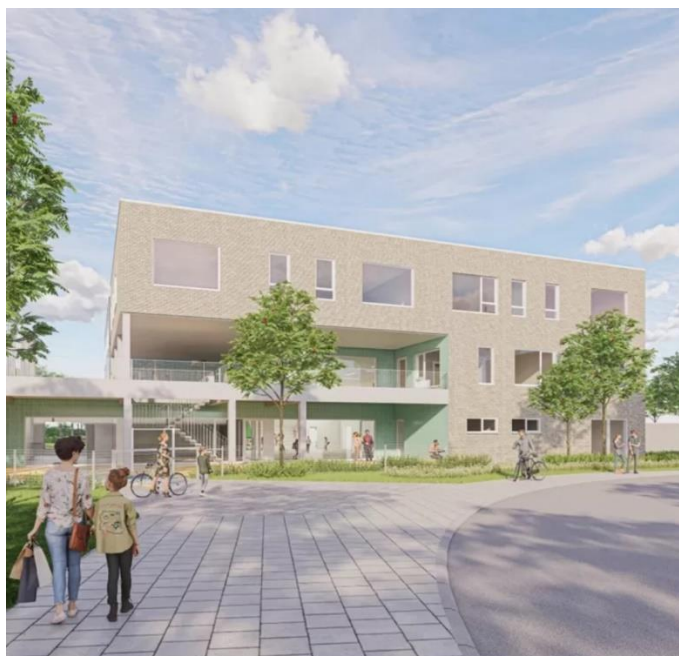
Zo moet de nieuwe school er uit gaan zien

De populariteit van freinetscholen stijgt jaar na jaar. Dat ondervindt men al geruime tijd in Villa Da Vinci, de secundaire freinetschool in de Koningin Astridlaan in Sint-Niklaas. Daar krijgen heel wat leerlingen noodgedwongen les in containerklassen door gebrek aan plaats in het hoofdgebouw. Hetzelfde verhaal in freinetbasisschool De Ark aan het Sint-Jansplein. Ook daar moeten containerklassen een oplossing bieden voor het plaatsgebrek.