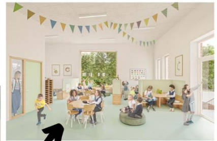
Een beeld van de binnenkant.