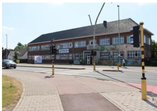
Het nieuwe complex komt achter het huidige gebouw in de Koningin Astridlaan te liggen

De site van De Ark op het Sint-Jansplein zal na de verhuizing van de leerlingen worden verkocht. Het gebouw van Casa Da Vinci in de Noordlaan zal mee opgenomen worden in de vernieuwingsplannen van heel de site .