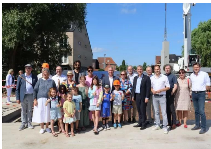
Het nieuwe schoolgebouw moet in april van volgend jaar klaar zijn.

De eerstesteenlegging ging gepaard met de plaatsing van de eerste betonnen steunbalk. In de die balk werden er tekeningen van de schoolkinderen gestopt.