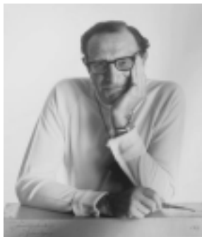
Eric Berne, grondlegger TA

Tijdens onze workshop informeren we je graag over de kerngedachten van TA en een aantal concepten. Ook ervaar je hoe TA voor jou kan werken. Daarnaast staan we stil bij het inzetten van TA met kinderen zodat zij ook leren wie ze zijn, hoe het komt dat ze zeggen wat ze zeggen en doen wat ze doen.